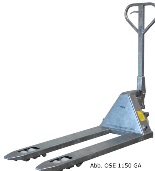
Abb. OSE 1150 GA