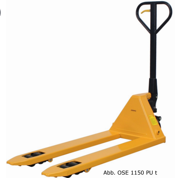
Abb. OSE 1150 PU t