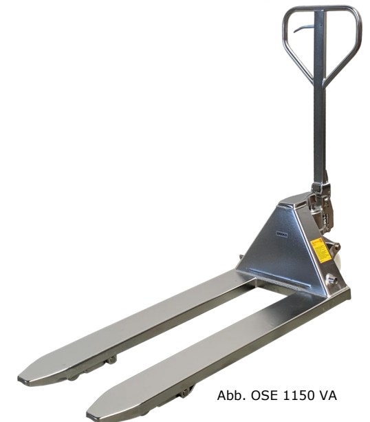
Abb. OSE 1150 VA

Farbabweichungen drucktechnisch bedingt möglich · Technische Änderungen und Irrtümer vorbehalten