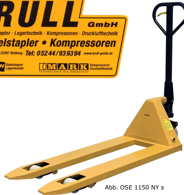
Abb. OSE 1150 NY s