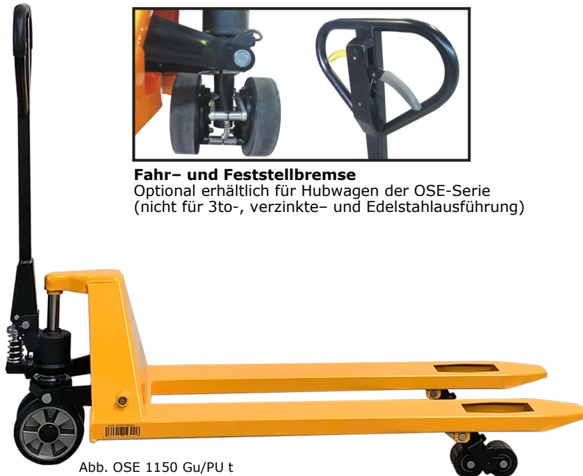
Abb. OSE 1150 Gu/PU t

Optional erhältlich für Hubwagen der OSE-Serie (nicht für 3to-, verzinkte- und Edelstahlausführung)