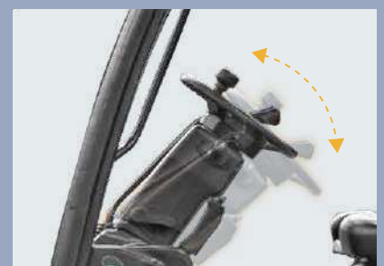
Das schmale Lenkrad lässt sich in der Neigung einstellen, so dass es jederzeit bequem in der Hand liegt.