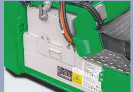
Die Akkusätze sind über manuellen oder elektrischen Wagen problemlos zu entnehmen, was Wartungsarbeiten bedeutend erleichtert.