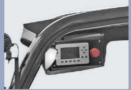
Die Instrumententafel ist oben angebracht und liegt durch leichtes Neigen des Kopfs bequem im Blickfeld. Die Bedientasten sind einfach zu drücken.