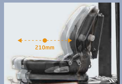
Der Sitz lässt sich um 210 mm nach vorne und zurückschieben, um dem Fahrer die bestmögliche Sitzposition zu bieten.