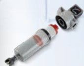
8102856084 Filter G 24 (G3/4) - 7