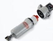
8102856087 Filter G 50 (G1) - 10