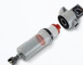
8102856087 Filter G 50 (G1) - 10