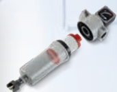
8102856084 Filter G 24 (G3/4) - 7